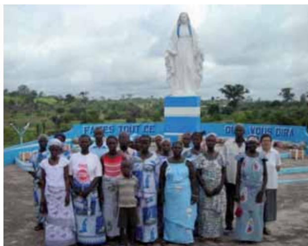
A sinistra: il gruppo di Abidjan - A destra: pellegrinaggio del gruppo di Sankadiokro al santuario «Notre Dame d'Afrique» ad Abidjan