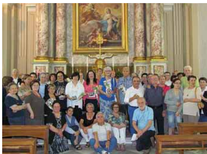
21-23 giugno 2013, Todi (PG), chiesa della SS.ma Annunziata: i partecipanti al XIII incontro nazionale dell'Associazione «B. V. Addolorata» posano davanti all'immagine della Vergine